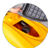
Débris tray + filtre