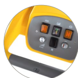
Panneau de commandes