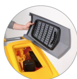
Debris tray + filtre de protection du moteur d'aspiration