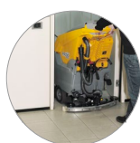
Système d'essuyage réglable et compact