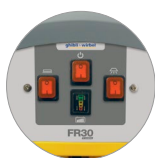
Panneau de commandes