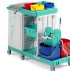
Magic Line 350P