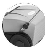
Système de blocage du manche pratique et rapide