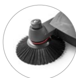
Brosses latérales réglables en hauteur