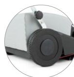
Roues arrières de grand diamètre