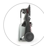
Dimensions compactes: facile à ranger