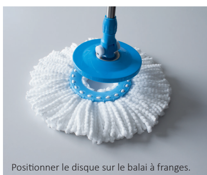
Positionner le disque sur le balai à franges.