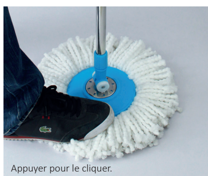
Appuyer pour le cliquer.