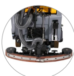
Système d'essuyage réglable... ... et compact