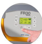
Fonction mode silencieux