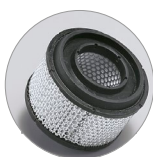
Filtre à cartouche HEPA (en option)