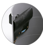
Dispositif anti-mousse (en option)