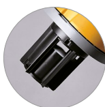
Cage support sac avec flotteur