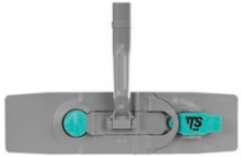
Support Blink Infinity