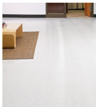
Apparence de départ