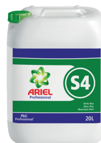
ARIEL PROFESSIONAL S4 BLANC MAX