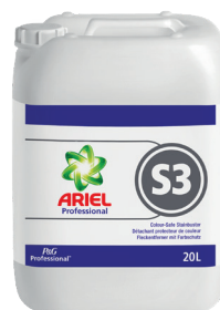
ARIEL PROFESSIONAL S3 DÉTACHANT PROTECTEUR DE COULEUR