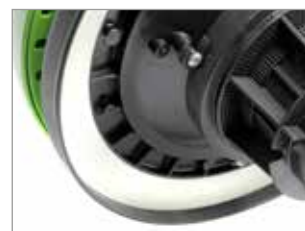
JOINT DE TÊTE NOVATEUR