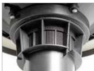
SYSTÈME ANTI-MOUSSE INTÉGRÉ